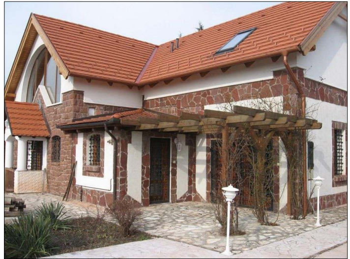
A paloznaki Meseterápia Központ

A családterápiás munkában nem csupán a konfliktusok kialakulásának megelőzése lenne a cél, hanem a már meglévő zavarok rendezése annak érdekében, hogy a család valóban betöltse egészségvédő és egészségmegőrző funkcióját. Folyamatban gondolják el egy család