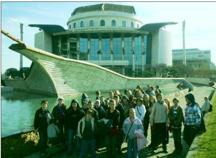
Ellátogattunk a Nemzeti Színházba is