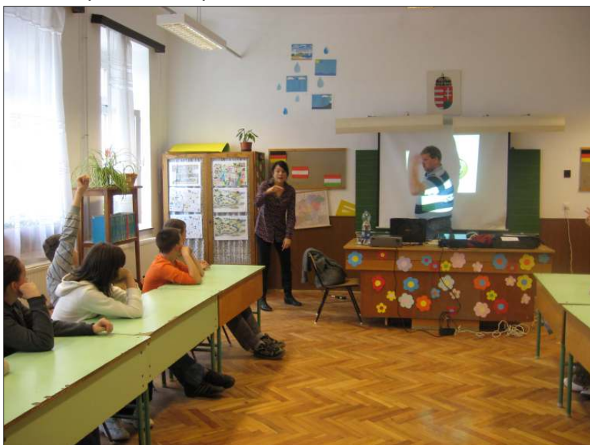
Siket előadónk és jeltolmács kísérője bepillantást engedett a hangok nélküli világba