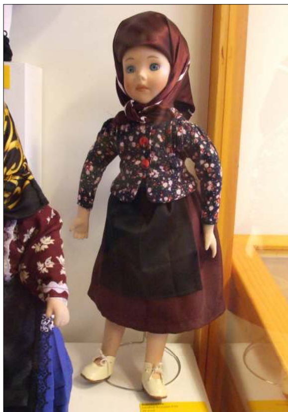
A használati tárgyakon kívül sok szép népviseletbe öltöztetett babát is láthattunk