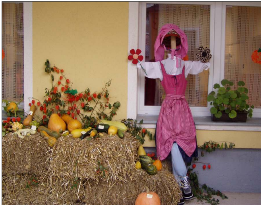
Örömmüket meg akartuk osztani másokkal, a falu lakóival, ezért az udvari kiállításunkat utcaivá is bővítettük.