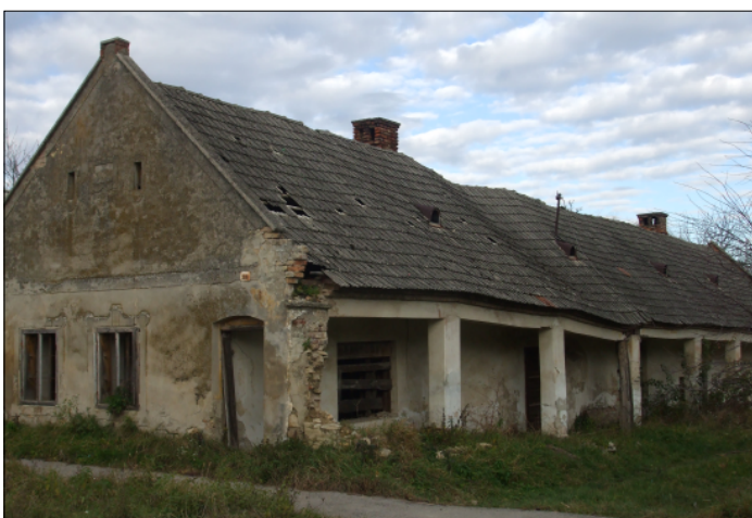
Elhanyagolt házak, romok, romos épületek Bakonynána utcáin