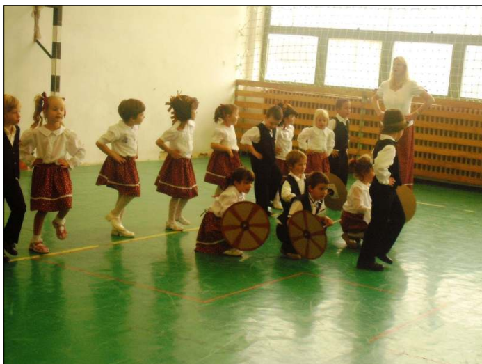
Tudásukat a picik is szívesen, örömtől sugárzó arccal teszik közzé

Eredményhirdetés nem volt, hisz a jutalmakat melyek kiosztásra kerültek, minden óvodás kiérdemelte. A gála után a rendezők az iskola aulájában látták vendégül a szereplőket és az őket elkísérő szülőket, nagyszülőket, akik méltán voltak büszkéik csemetéik teljesítményére.