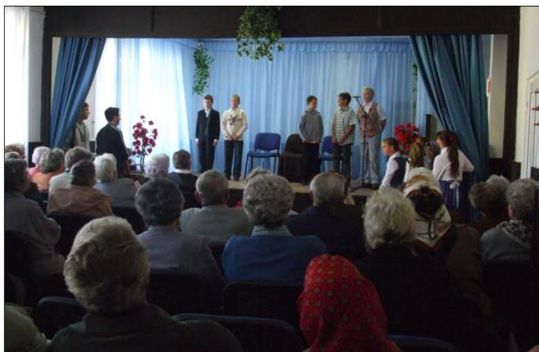
Az általános iskolások ünnepi műsorral kedveskedtek az időseknek