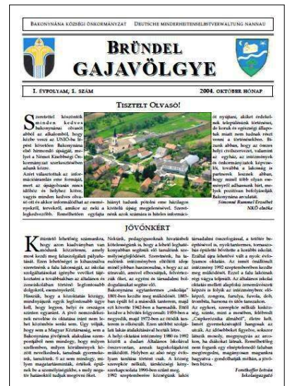
A Bründel-Gajavölgye első számának címlapja

szorította a mindenszentek később kialakult hagyománya.