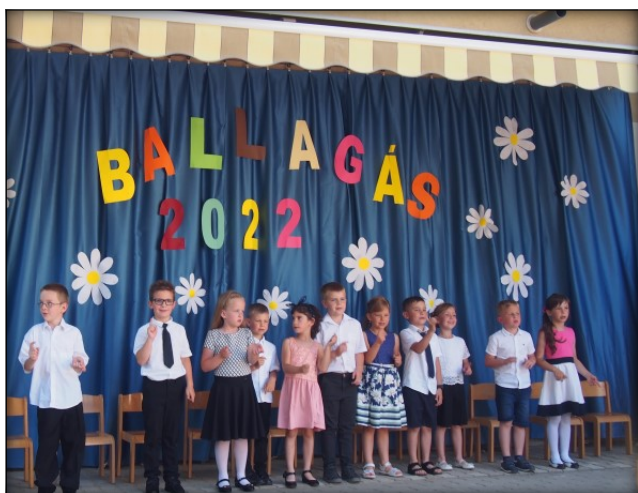
Az óvodai ballagók (balról jobbra)