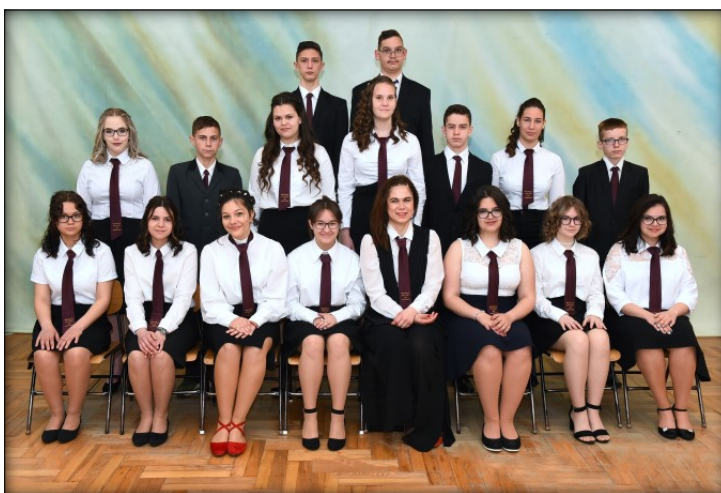
Az általános iskolai ballagók (balról-jobbra):

Soha ne felejtsd el, kik téged szeretnek, Soha ne fordíts háttal az embereknek. Szeresd a szépet, keresd a jót, Ha szükséged van rám, én mindig itt vagyok.