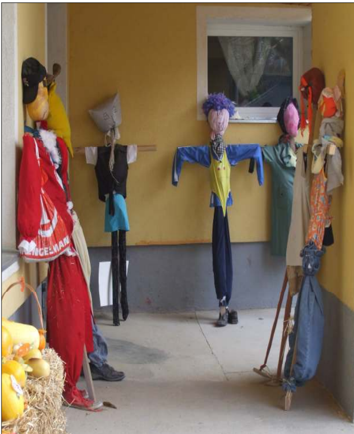
A színes, bolondos figurák vidáman vigyáztak ránk néhány hétig Die schönsten Vogelscheuchen am Schulhof