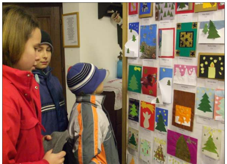
Gazdag képeslap-kiállítás a múzeumban Ausstellung ins Heimatmuseum von handgebrauchten Ansichtskarten