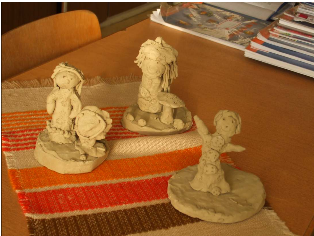
Az elsősök alkotásai – Gebilden von Kinderhänden von die erste Schulklasse

egy tündért, majd bőrből készítettek maguknak karkötőt. A délután csúcspontja mégis az volt, amikor megjelentek a nép-