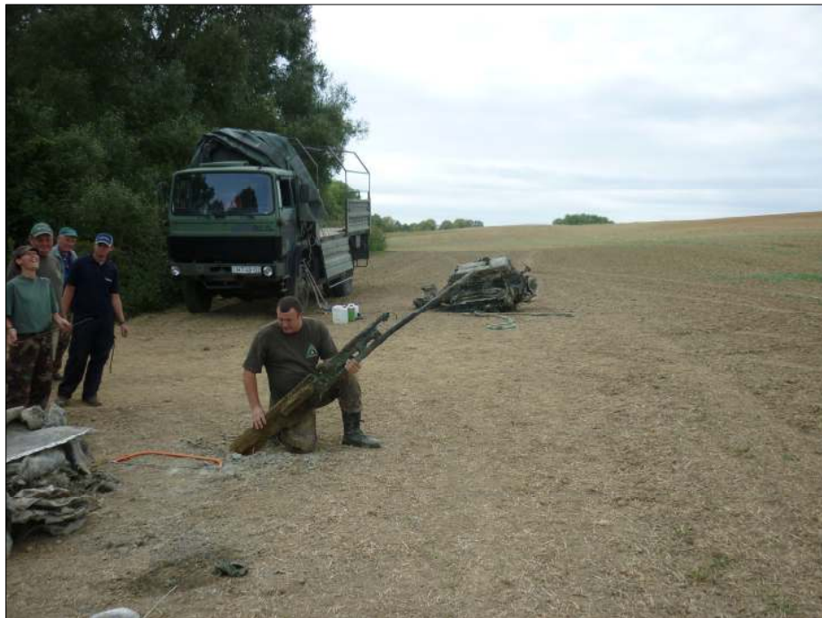
Véget ért az első orosz-magyar kutatóexpedíció Die erste russische-ungarische Forschungsexpedition ist bald zu Ende

potban, szinte 1945-ös állapotában konzerválódtak, ennek oka a szürke agyagréteg volt, amely légmentesen elzárta a repülőgép maradványait a korróziót felgyorsító oxigéntől és nedveségtől. A munkagödörben a feltárás alatt végig lehetett érezni a jellegzetes repülőgépüzemanyag-szagot, majd a kiemelés után össze tudtuk gyűjteni a teljesen tiszta motorolajat is, amely a Mikulin AM-38-as motorból szivárgott ki (motorszám: 257728). A feltárás végére egyértelművé vált, hogy a gödörben nincs benne a pilótafülke, ezért a személyzetből senkinek sem sikerült megtalálni a földi maradványait. Valószínűsíthető, hogy a gép becsapódása után a földből kiálló részeket a helyiek elbontották, és a pilóták földi maradványait (ha megtalálták) eltemették valahol a környéken. Ezzel a feltárással véget ért az első orosz-magyar kutatóexpedíció.