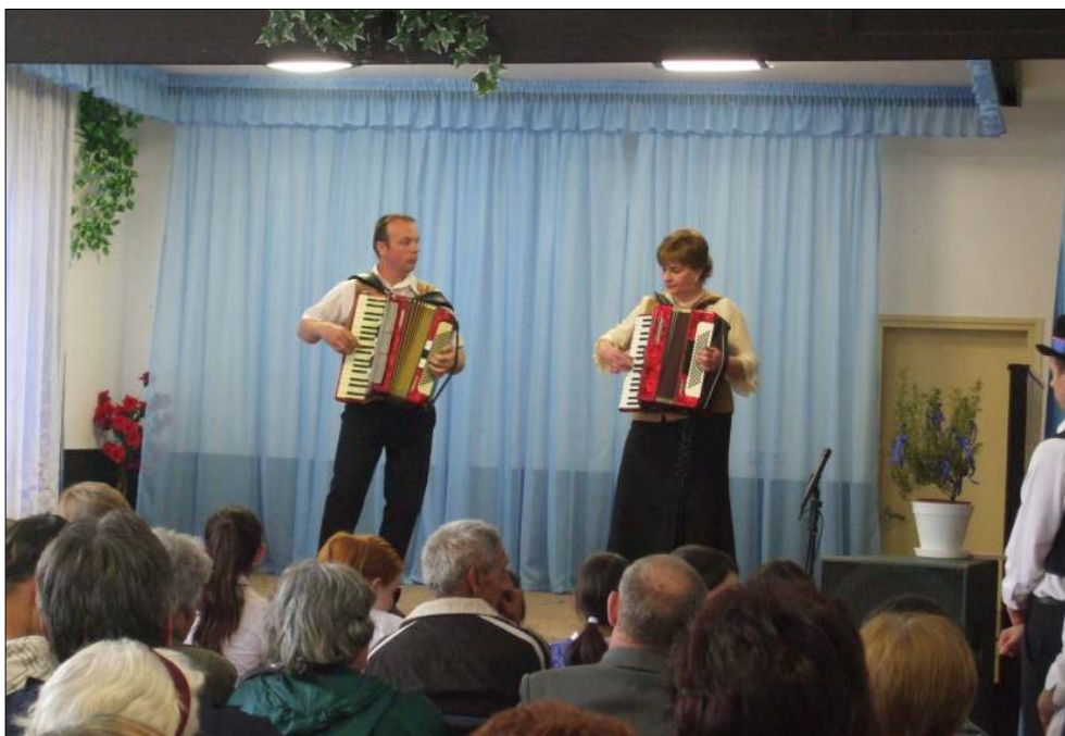
A Wasserfall harmonikaduó a 2011. évi Német Nemzetiségi napon Die Wasserfall Harmonikanten am Deutschen Nationalitätentag-26.04.2011