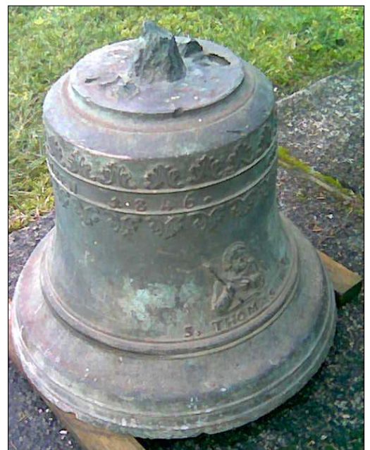
Nach 56 Jahr Rast wurde die Kleindudare Glocke im Juni 2011 am Kirschturm aufgehängt. Nach die Einweihung (2.10.2011) ist am 19.11.2011 in zwißen läuten gebrochen.

Most újra néma a torony. Örültünk a megszólalásának, és döbbenet volt hallani a hírt, hogy összetört. Mintha meghalt volna. Valóban meghalt. Új harangot kell öntetni, hogy hangjával hirdesse Isten dicsőségét és szolgálja az em-