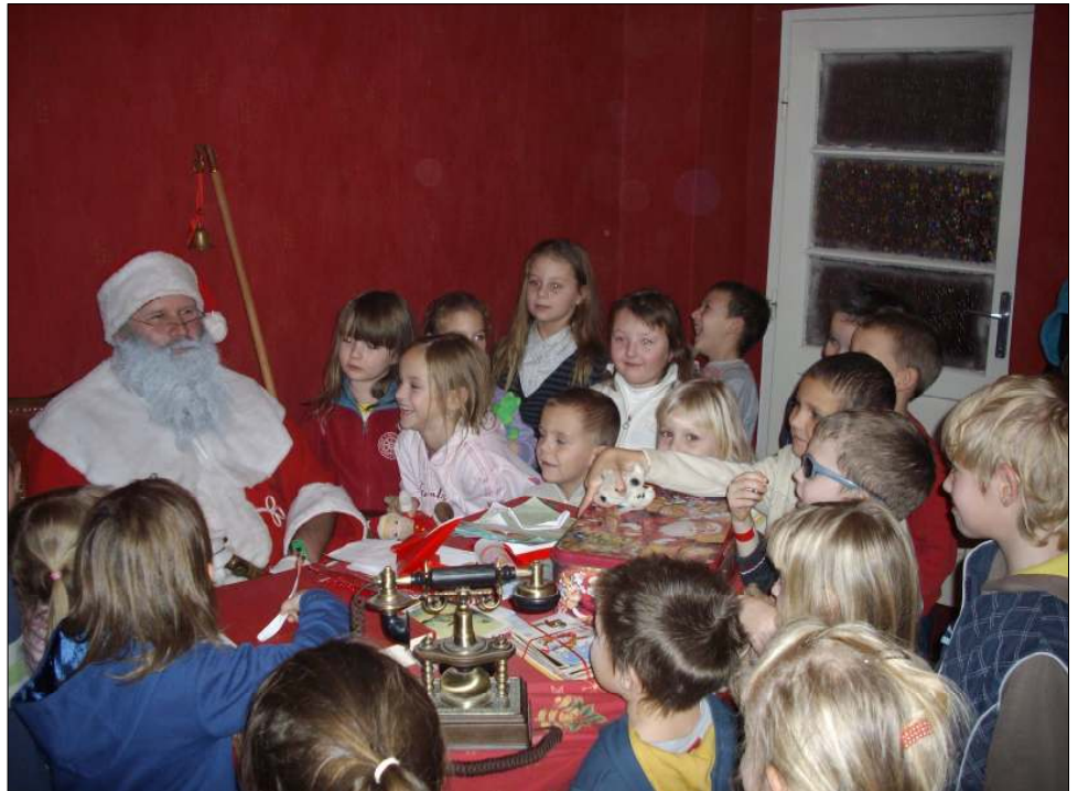
Nagy volt a nyüzsgés a Mikulás körül – Der Nikolaus hat viel Arbeit gehabt

Az út hosszú volt, ezért a gyerekek gyakran kérdezték, hogy mikor érünk már oda. 9:30-kor végre megérkeztünk. Kíváncsian szálltunk le a buszról. Első utunk a Mikulás házához vezetett. A Mikulás szeretettel fogadott minket és megmutatta nekünk a házat. A gyerekek kérdezhettek a Mikulástól és Ő kedvesen válaszolt. Ezután mindenki egy kis ajándékot is kapott. Az ajándékért cserébe a gyerekek átadták a Mikulásnak szánt rajzokat, majd pedig elénekelték az óvodában tanult dalokat. Miután elköszöntünk a Mikulástól elindultunk megnézni a rénszarvasokat, majd felültünk a csillagjáró szánra, és beszélgettünk a titkot őrző manókkal. A templom mellett található egy életnagyságú betlehemi szobor is, amelyet szintén megnéztünk, majd ellátogattunk a karácsonyi múzeumba. Az idő többi részét egy hatalmas játszóházban töltöttük. Itt lehetőség volt