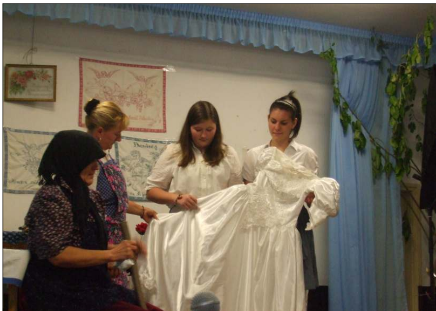
Egy menyasszonyi ruha története – Geschichte von einem Brautkleid

Aki nem akart eljönni 2011. október 23-án a Kultúrotthonba, az bizony már bánhatja. Akik viszont láthatták az ízes előadást, azok biztosan jól érezték magukat. Az előadás után minden