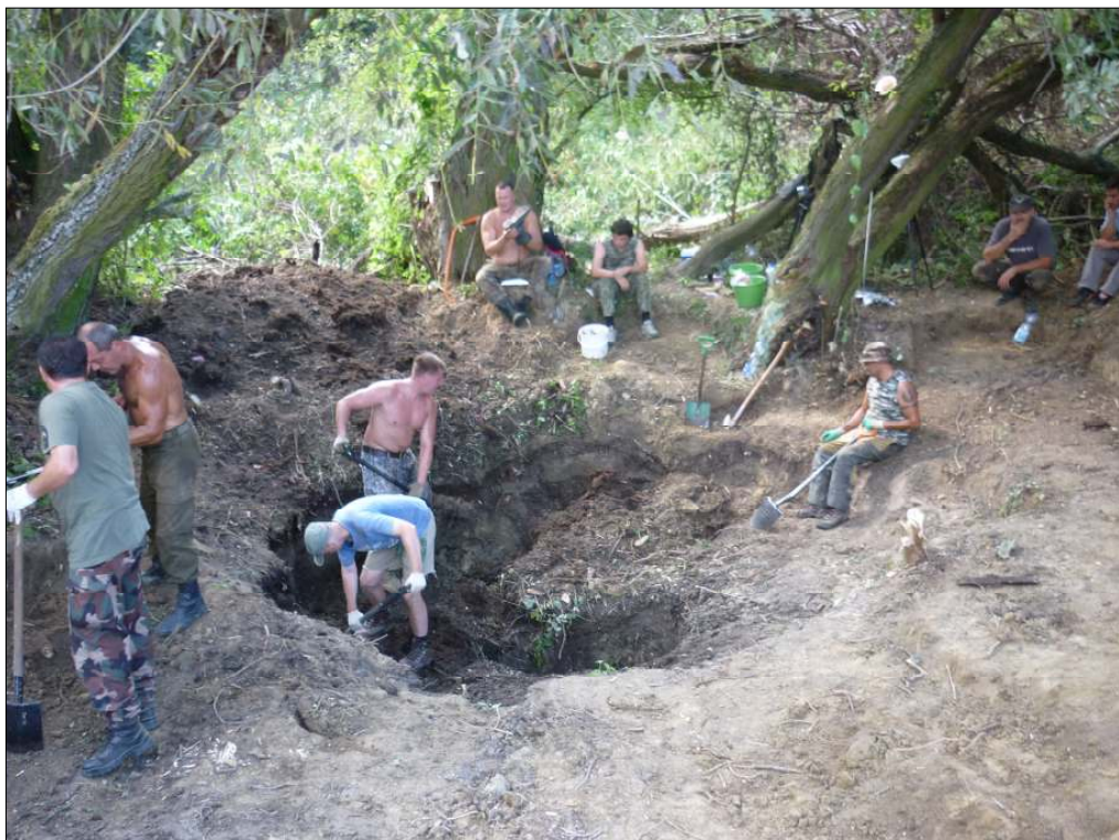
Repülőgép roncsokat keresnek a nánai határban Trümmerforschung am Nanauer Acker