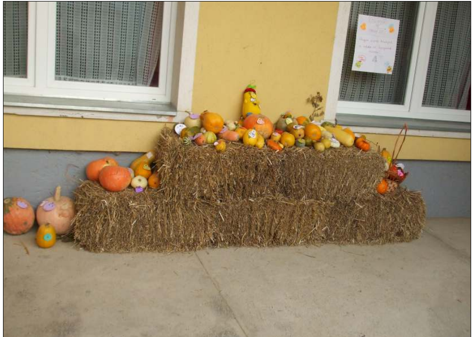
Szebbnél szebb, különböző színű és formájú terméseket hoztak a gyerekek Kürbisfestival in der Schule

A tökfesztivál kísérő programja a madárijesztő-öltöztető verseny. Minden osztály hozzájárult ahhoz, hogy még hangulatosabb legyen pár hétig udvarunk. A sok színes, bolondos figura vidáman vigyázott ránk néhány hétig, ha nem is a madarakat, talán a rossz kedvet elijesztette a házunk tájáról.