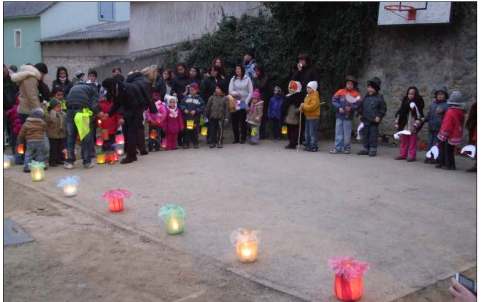
Sankt-Martins-Umzug in Nana am 11. 11. 2011 Lampionos felvonulás Bakonyánán, 2011. november 11-én

Vor der Gemeinde und vor der Schule brennen schon die Kerzen, die Polizei wartet schon mit zwei Auto auf die Strasse. Die Kleinkindern von Kindergarten vorweisen die Geschichte von Sankt Martin. Langsamm wird es dunkel, da nach zieht