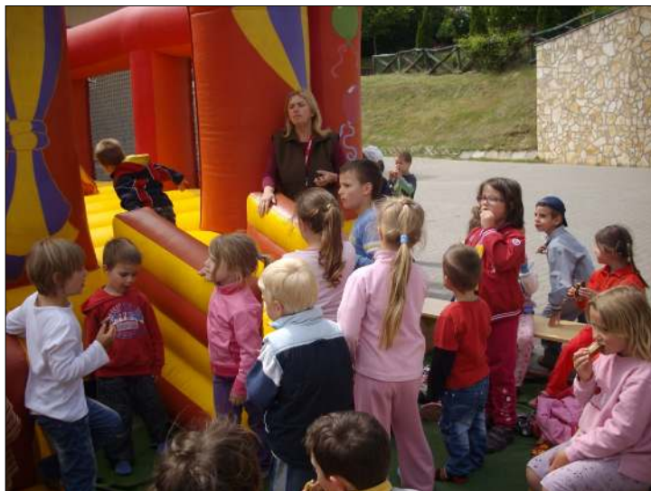
A gyerekek örömmel vették birtokba a légvárat

Bízunk benne, hogy élményekkel gazdagon tértek haza ezután a tartalmas, és fárasztó nap utána gyerekek és a szülők egyaránt.