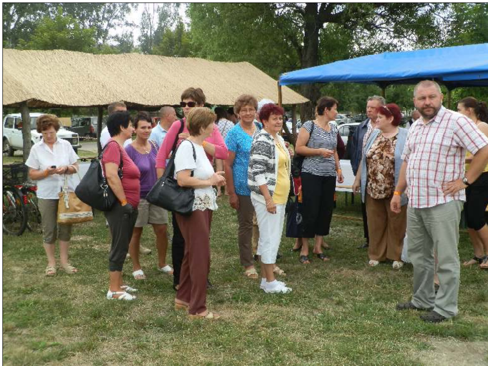
Jól éreztük magunkat ezen a találkozón, lehetőségünk volt arra, hogy megismerjük egymás kulturális értékeit. Die sieben Nana Dörfer treffen sich in Hajdunanas

A nevező csapatok bográcsaiban már készültek a finomabbnál-finomabb hajdúsági pásztorételek. A településeknek külön sátraik voltak, ahol lehetőség volt a bemutatkozásukra. Mivel mi a főzőversenyre nem neveztünk, ezért egy jellegzetes sváb étellel (tepertős káposztával) kínáltuk az érdeklődőket. A megnyitó után hamarosan sor került a folklór csoportok fellépésére. Dalkörünk ez alkalommal a sváb énekek mellett magyar népdalokkal is szórakoz-