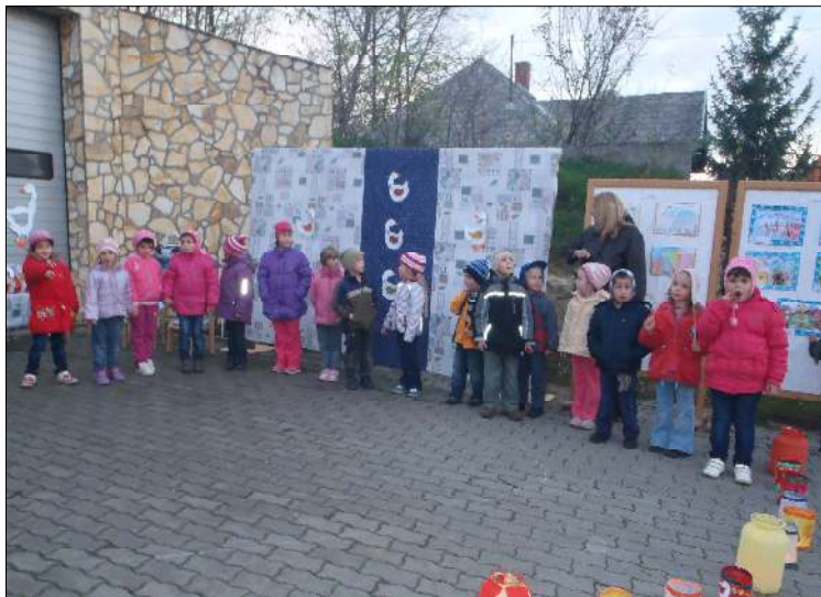
Az óvoda udvarán paravánon állítottuk ki a gyerekek által készített rajzokat. Martintag im Kindergarten

Köszönjük a lelkes szülőknek, finom süteményeket, és a Német