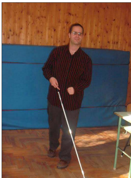
Esélyegyenlőségi óra iskolásoknak