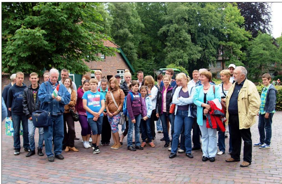
A csoport egy része már nem először tette meg ezt az utat. Begegnung in Jade