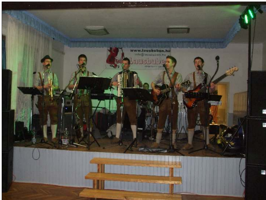
A Lausbuben zenekar húzta a talpalávalót Die Lausbuben machten gute Laune

Dann ist die einzige Gästegruppe auf die Bühne gekommen, sie waren der wunderbare Nationalitäten Singchor von Nagytevel. Trotzdem, dass die Zahl von ihnen nicht ganz voll war, haben sie eine hervorragende Vorführung vorgestellt.