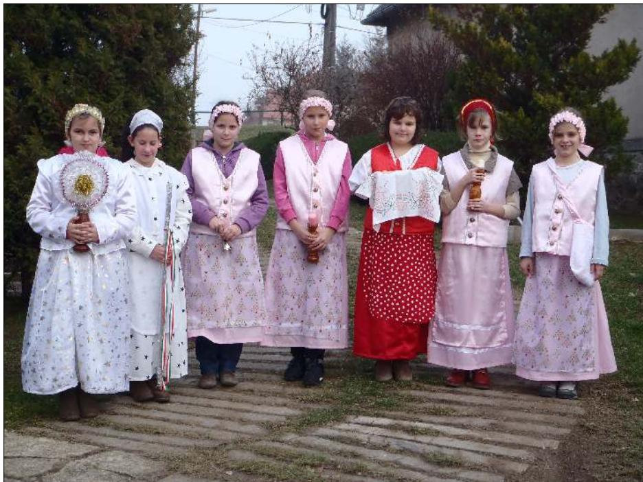
A hét lány németül és magyarul, verssel és énekekkel köszöntötte a családokat karácsony előtt. Christkindelspiel in Nana 2013