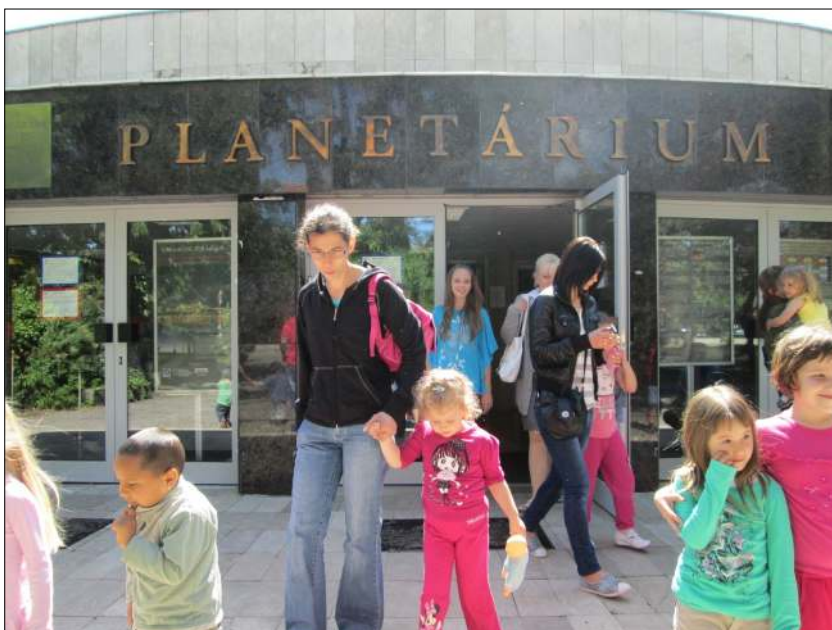
A Süni és a Csillagok című előadást tekintettük meg a Planetáriumban. Die Kleinfölkchen machten Ausflug in Budapest

Újdonság az állatkert közepén található Varázshegy volt, ahol a