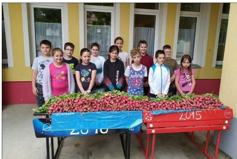
Retekszüret – 3. osztályos tanulók