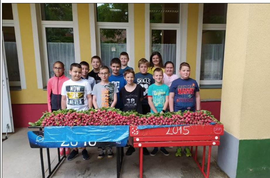
Retekszüret – 4. osztályos tanulók