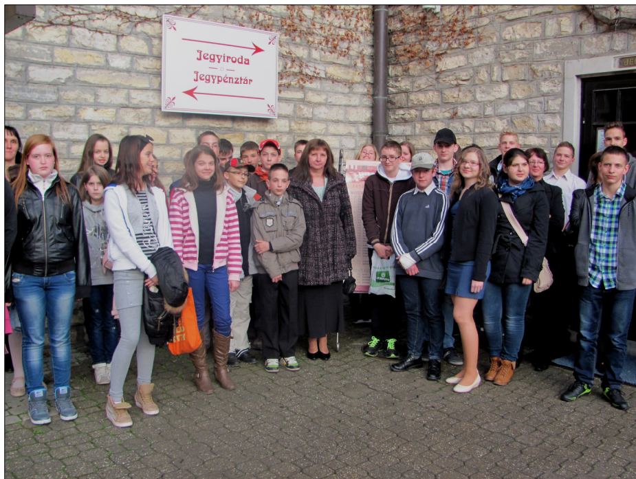
Elgondolkodtató volt az előadás felnőtteknek, gyerekeknek és pedagógusoknak egyaránt.

Hangos zsvijv töltötte meg a termet, amikor a 3. B osztály tanulói megjelentek a Nagyszínpadon. Fergetes tánccal, vidámsággal töltötték meg a szereplők a termet. Megjelent a régi kor minden jellemzője, a ruhák, a díszletek, a beszédstílus és az erkölcsi értékek, amik abban a korban még jelentettek valamit. Megismerhettük a diákok kollégiumi és iskolai életét, a lecsúszott nemesség akkori helyzetét és a tanárok viselkedését. Nyilas Misit, aki példát mutatott minden gyerekeknek akkor és most is. Elgondolkodtató volt az előadás felnőtteknek, gyerekeknek és pedagógusoknak egyaránt. Gondolkodóba estem, hogy voltam-e ilyen gyerek, vagyok-e ilyen felnőtt és milyen tanító vagyok Nyilas Misihez képest? Kit választanék magamnak példaképnek a tanárok