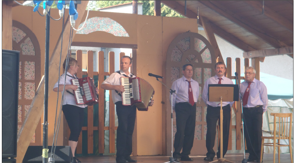
Nánai dalnokok a XIV. Nána-találkozón Bei Nána-Treffen die Nanaer Sängers in Oberungars Nana