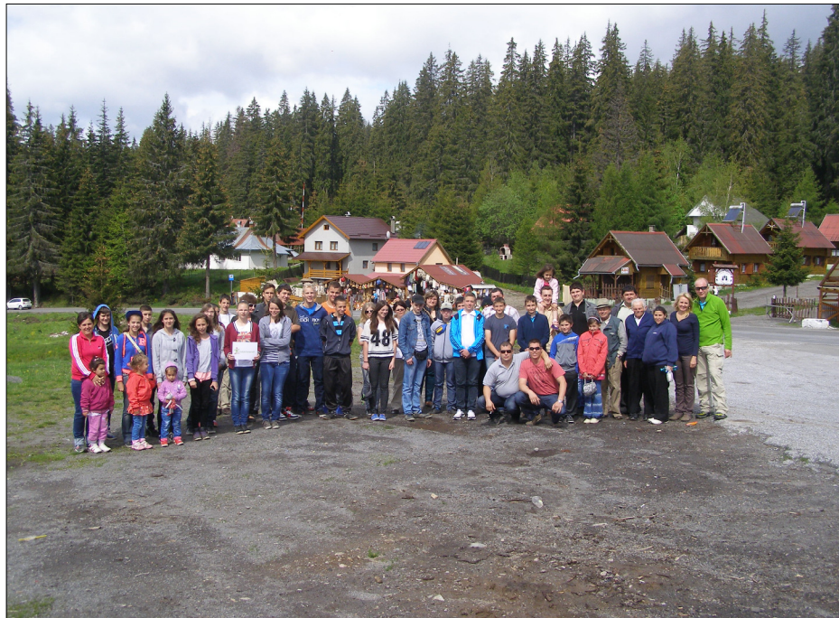
Minden résztvevő számára maradandó, mély emlékeket hagyott az utazás. Die nanaer Gruppe in Siebenbürger

Megajándékoztak minket ételükkel - díjnyertes lekvárjaikból mintát is