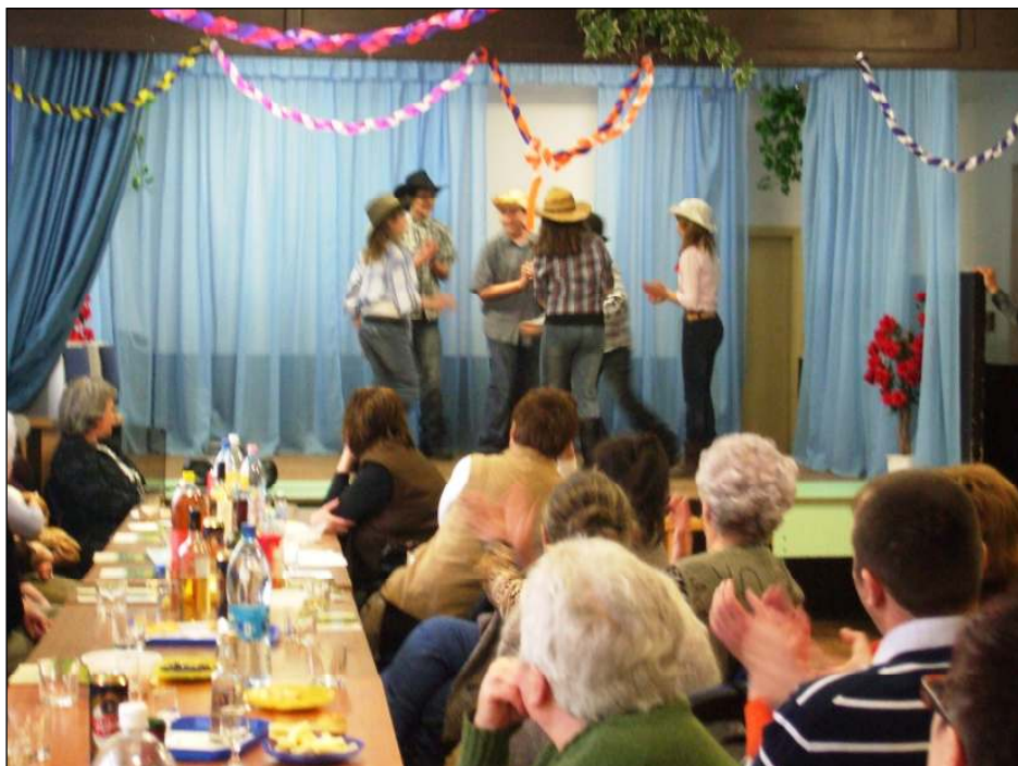
A teadélutánra most is csak a „bátrabbak” merészkedtek eljönni