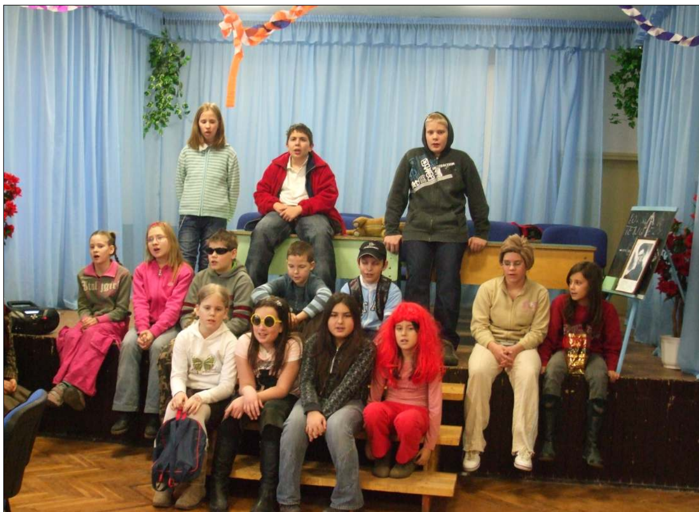
A gyermekszereplők élvezetes műsorszámakkal egy kellemes, közösségben eltöltött délutánt biztosítottak az egyedül élők számára.