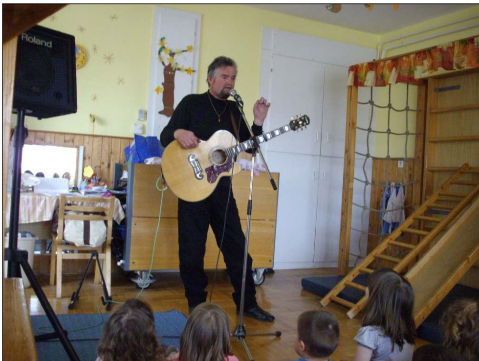
Az előadásba a bátrabbak is részt vehettek. Volt, aki hangszeren kísérhette az előadót.