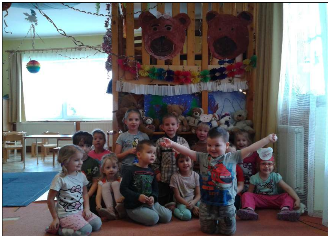
A csoportban a gyerekek medvével kapcsolatos mondókákat, verseket és énekeket tanultak Teddybär-Woche im Kindergarten