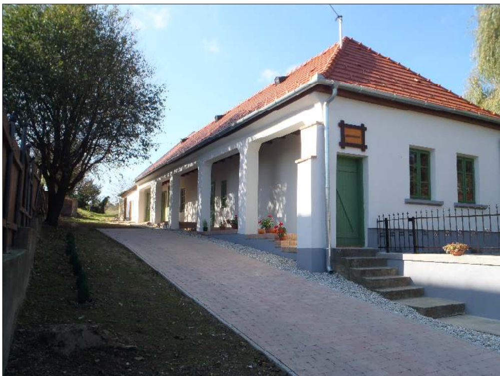
A helytörténeti kiállítás anyaga a „Tájházban” tekinthető meg Das neue Sehenswürdigkeit in Nana