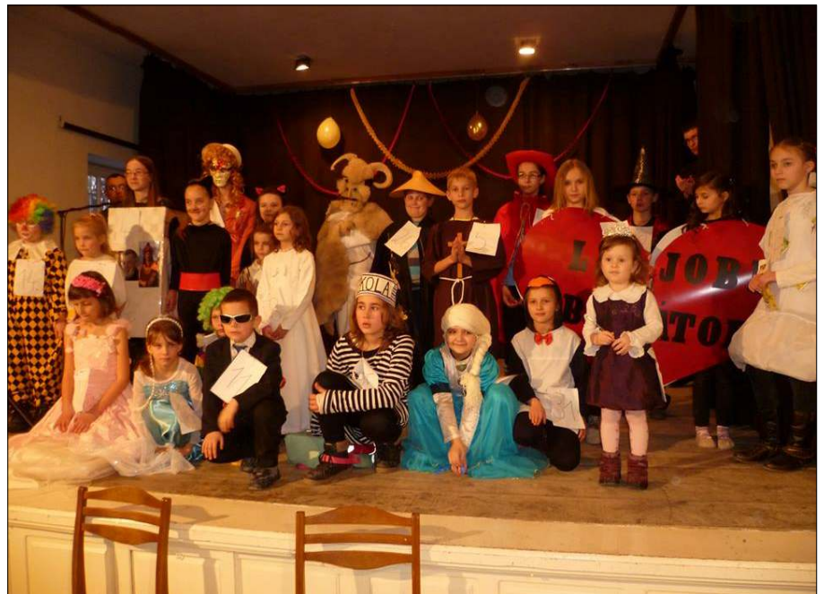
Megadtuk a módját a farsangi mulatozásnak, vidámságnak. Lustige Fasching halten am ersten Katholische Faschingsfest