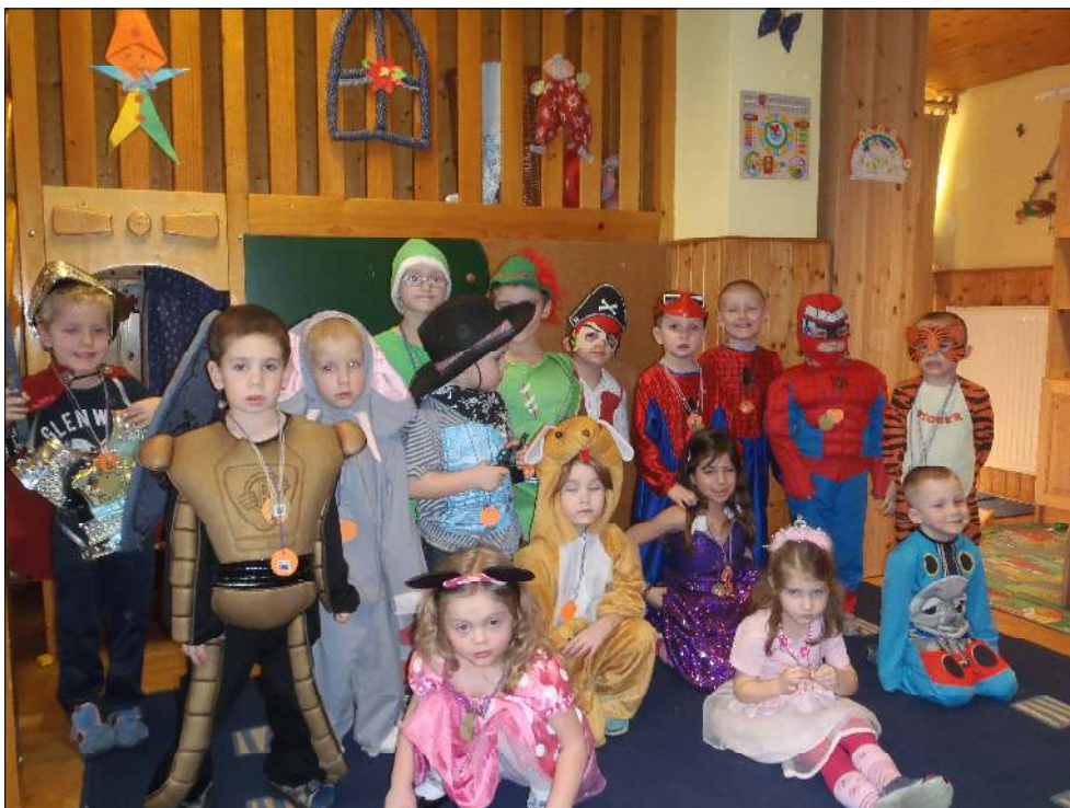
A szülők ötletes jelmezeket készítettek a gyermekeik számára. Faschhingsfest im Kindergarten