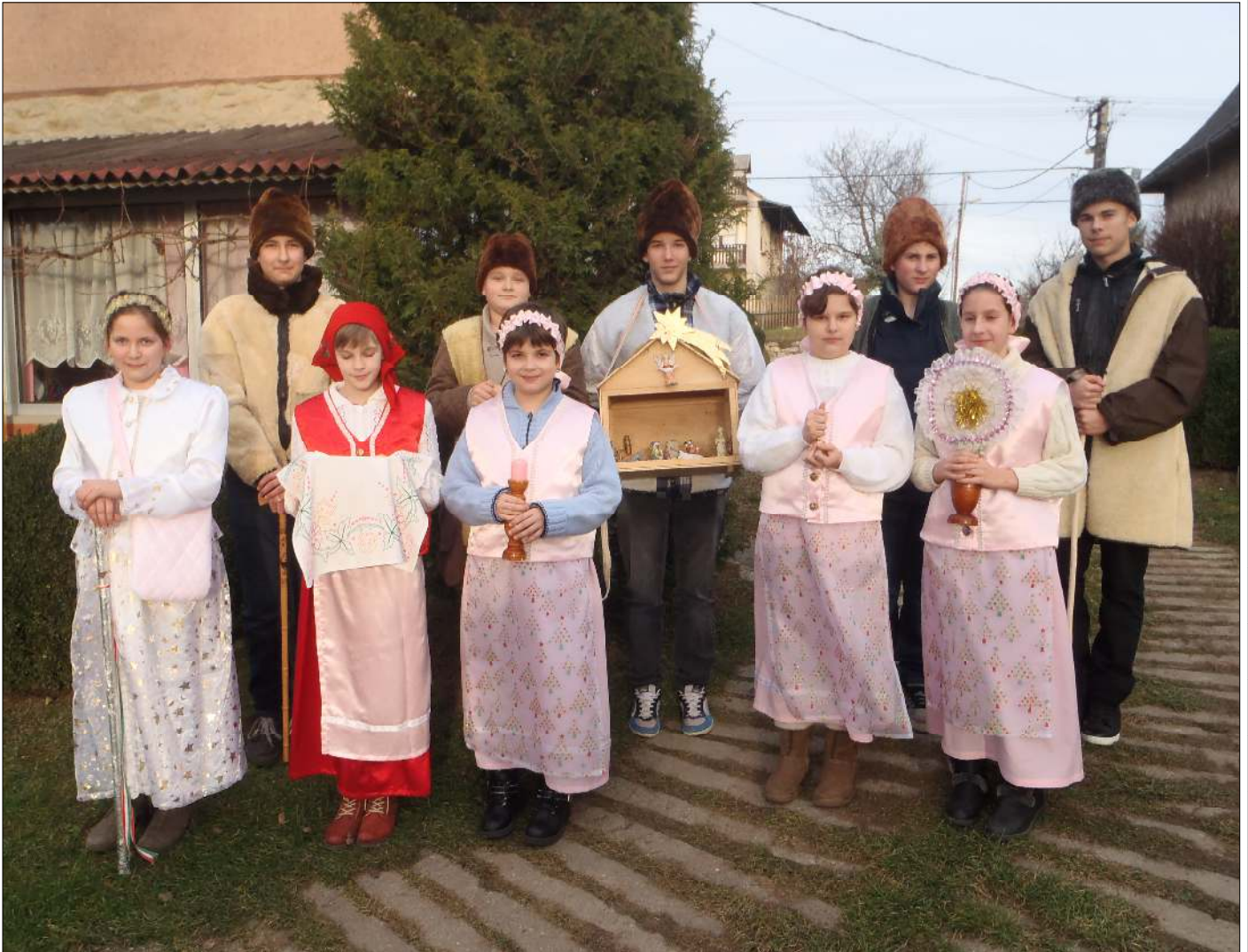
Volksbrauch vor Weihnachten im Jahr 2014